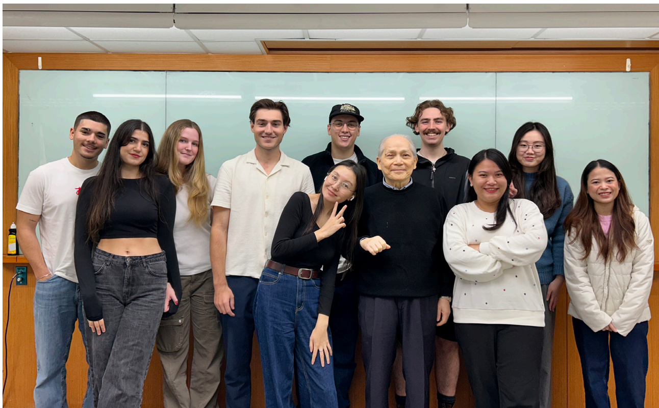
▲東吳商學院全英語碩士班國際商管學程，匯聚多國學生，在全英語授課環境中進行跨文化學習。

此外，為擴大學習機會，商學院也將 IEP 向下延伸，開放高三透過繁星或申請入學錄取的準大一新生參加。希望在不影響教學品質的前提下，協助更多學生提早銜接大學學習，縮短適應期，進一步強化英語能力。